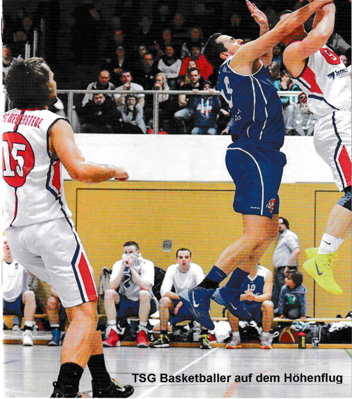
TSG Basketballer auf dem Höhenflug