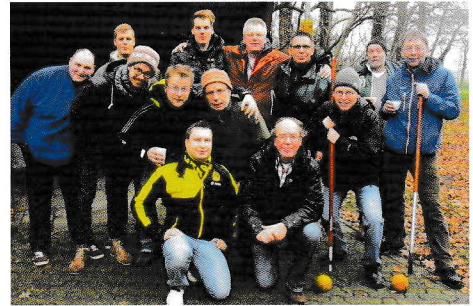
Boßeln 1. und 2. Mannschaft

Im Kinderturnen der TSG Westerstede gibt es 8 Gruppen. In den beiden Eltern-Kind-Gruppen, die donnerstags von 15:30 bis 17:30 Uhr in der Brakenhoffhalle turnen, tummeln sich etwa 65 Kinder, die von einem Elternteil oder Oma/Opa begleitet werden. Die Kinder sind im Alter von 14 Monaten bis zu 4 Jahren. Das Angebot wird vor allem in den Monaten Oktober bis Mai in dieser großen Anzahl genutzt. Die Leitung haben Marianne Rohlfis und Heike Tax. Die vielen phantasievollen Aufbauten aller großen und kleinen Sportgeräte, die im Turnen üblich sind, wirken sehr motivierend, sagen die Eltern. Den Abschluss jeder Stunde bildet ein gemeinsamer Kreis mit Sprechen, Singen oder Fingerspielen. Höhepunkte im Jahresablauf sind themengebundene Aufbauten, etwa zu Ostern und Weihnachten, und das Faschingsturnen zusammen mit den beiden Vorschulkindergruppen. Zur selben Zeit turnen zwei Vorschulkindergruppen bei den Übungsleiterinnen Petra Holz und Anja Keppner. Etwa 40 Jungen und Mädchen im Alter von 4 ½ bis 6 ½ Jahren nehmen das Angebot wahr. Da Petra und Anja nur ein Hallenteil zur Verfügung