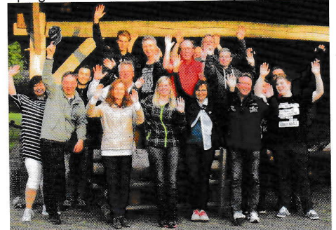
Spargel in Eggelege

eingeladen sind, in jedes Jahr wechselnden Lokalisationen sind zwischen 25 und 35 Teilnehmer bei einer Gemeinschaftskohlfahrt dabei, bei der alle Jahre vorab eine längere Wanderung dazugehört; anschließend wird reichlich getanz und gefeiert. Zur Spargelzeit im Mai, also immer nach Abschluss der Punktspiele, findet unsere Spargeltour an einem Freitagabend statt.